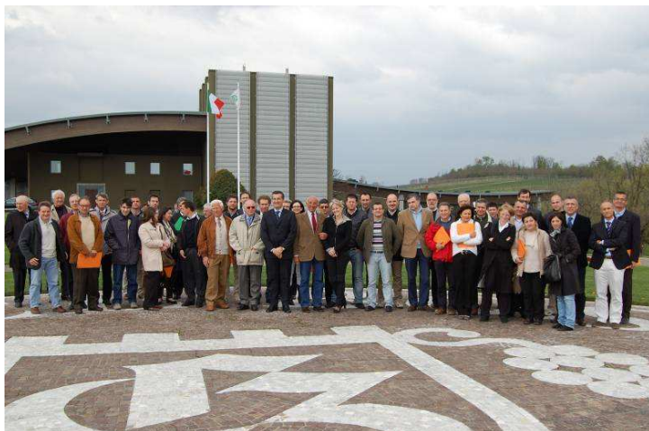
Partecipanti all'assemblea annuale 2010