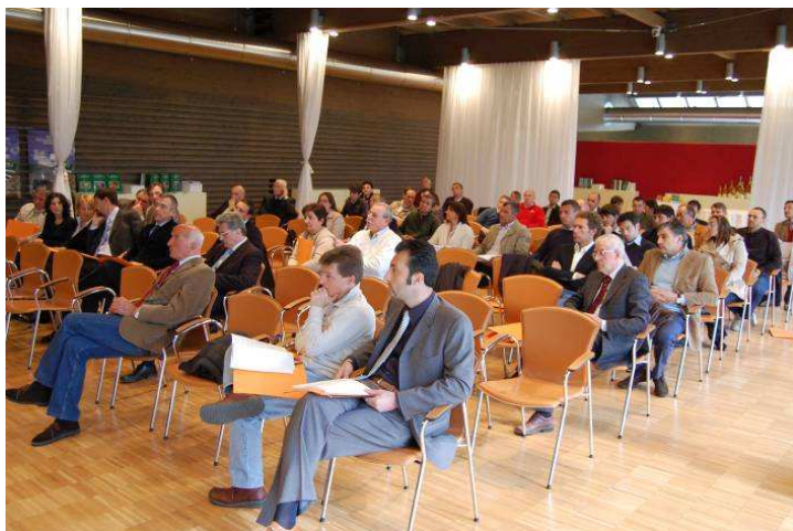
Partecipanti all'assemblea annuale 2010

L'Ordine di Brescia conta oggi 230 iscritti, di cui 48 donne, con un trend in aumento; i dottori forestali costituiscono il 17% degli iscritti.