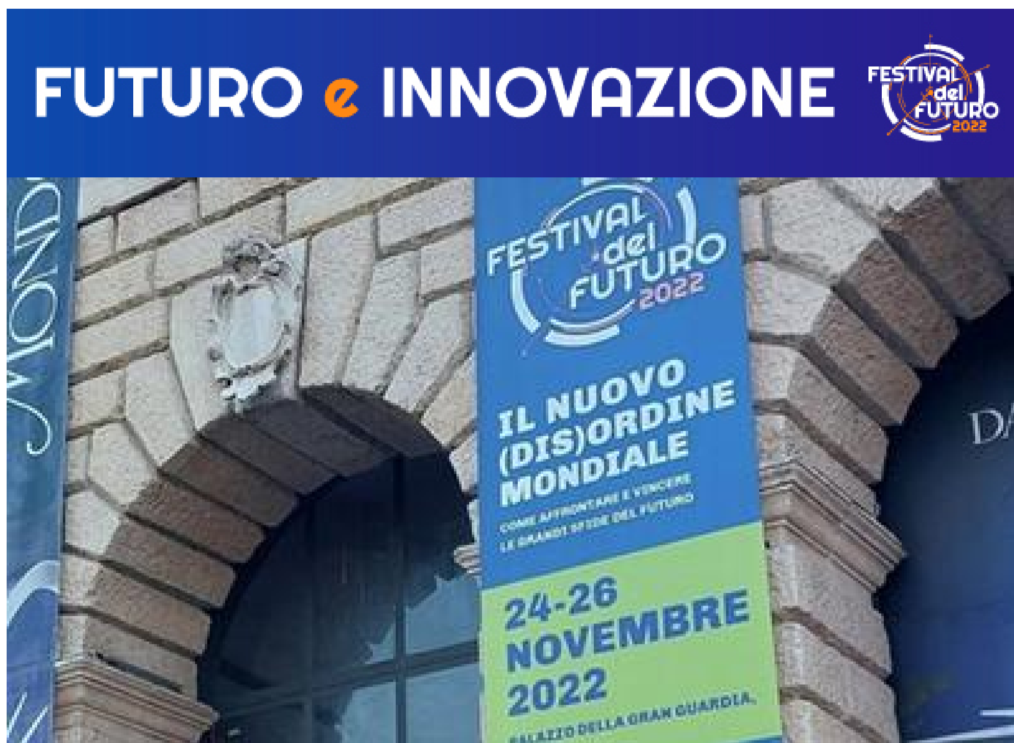
Festival del Futuro, al via la quarta edizione: al centro le crisi e le risposte alle nuove sfide