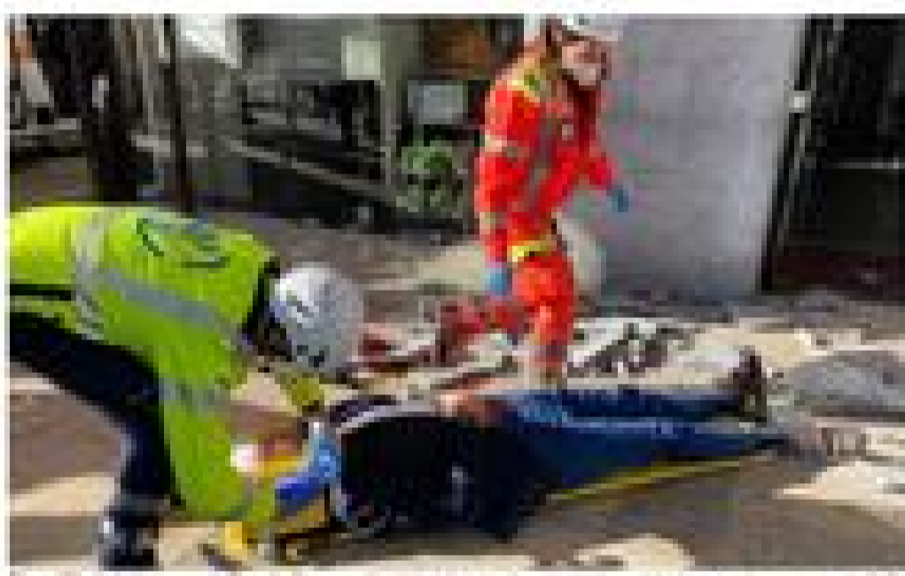
Un agente di una ditta di caffè è stato colpito e ferito da una lastra di marmo di 240 chili che si è staccata da un edificio e è caduta in piazza Vittoria di Brescia.

I l crollo di una lastra di marmo di 240 chili in piazza Vittoria di Brescia ha provocato un incidente gravissimo. Un agente di una ditta di caffè è stato colpito e ferito. L'agente è stato trasportato in ospedale e si trova in gravi condizioni. L'incidente è avvenuto durante un'operazione di manutenzione. La lastra di marmo si è staccata da un edificio e è caduta in piazza. L'agente è stato colpito alla testa e al petto. L'incidente ha causato danni per circa 100.000 euro. L'azienda è stata multata per aver eseguito lavori senza le dovute autorizzazioni. L'incidente ha messo in luce la mancanza di sicurezza nei lavori di manutenzione. L'azienda è stata multata per aver eseguito lavori senza le dovute autorizzazioni. L'incidente ha messo in luce la mancanza di sicurezza nei lavori di manutenzione.